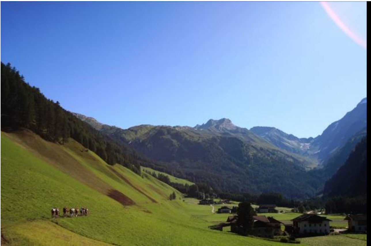
Vista sulla val di Vizze, stupendo verde!