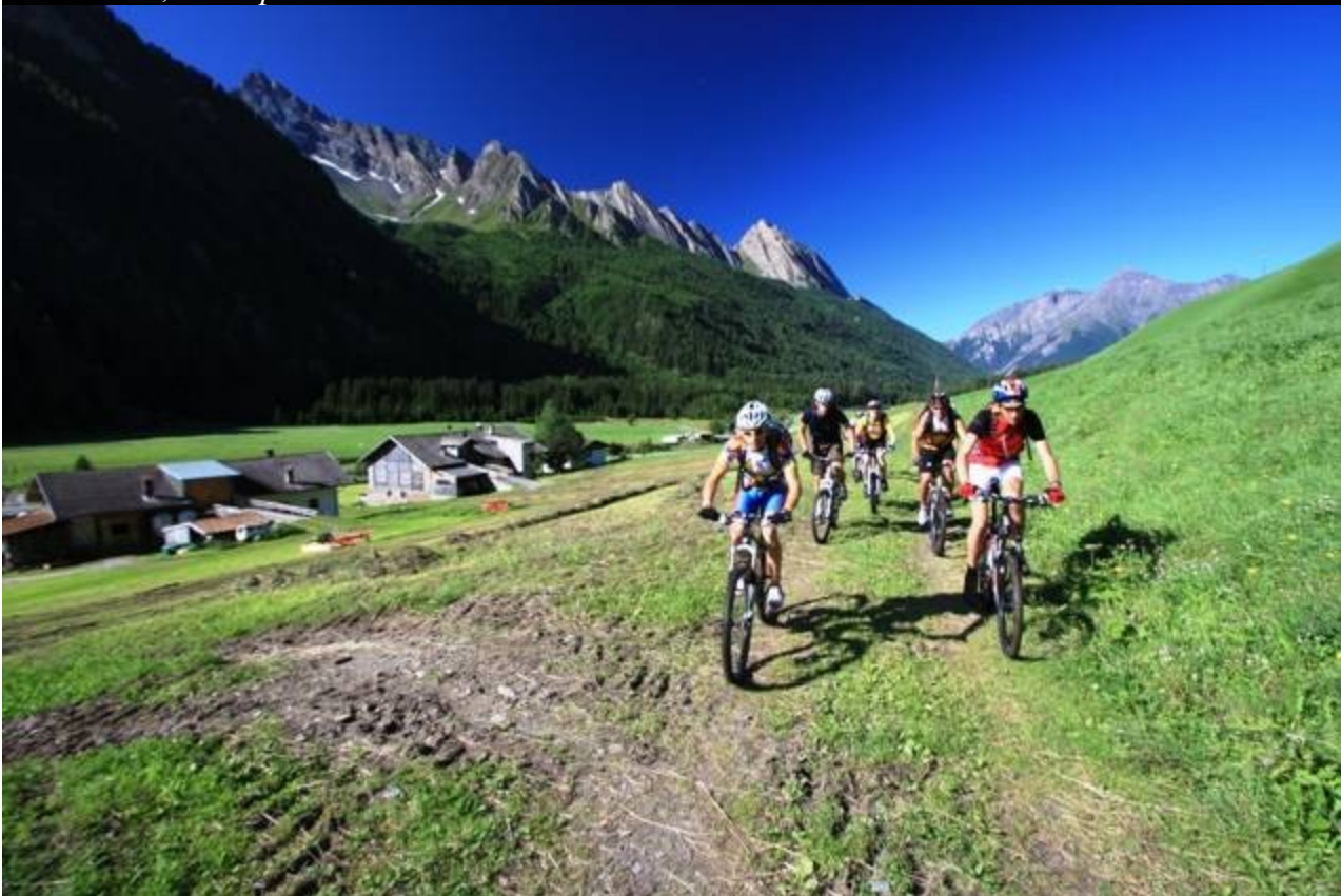
Val di Vizze, verso passo Vizze