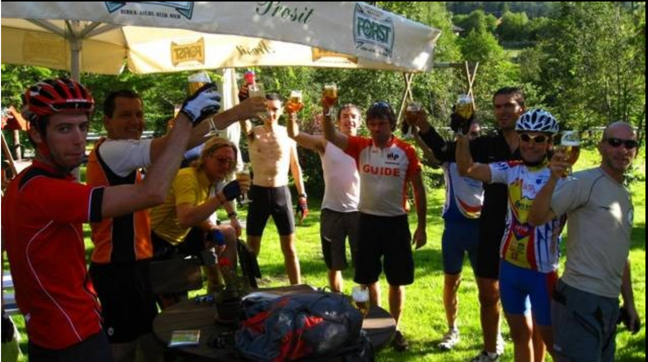
V tappa: Val di Vizze – Passo Vizze – Zillertal - Tuxertal